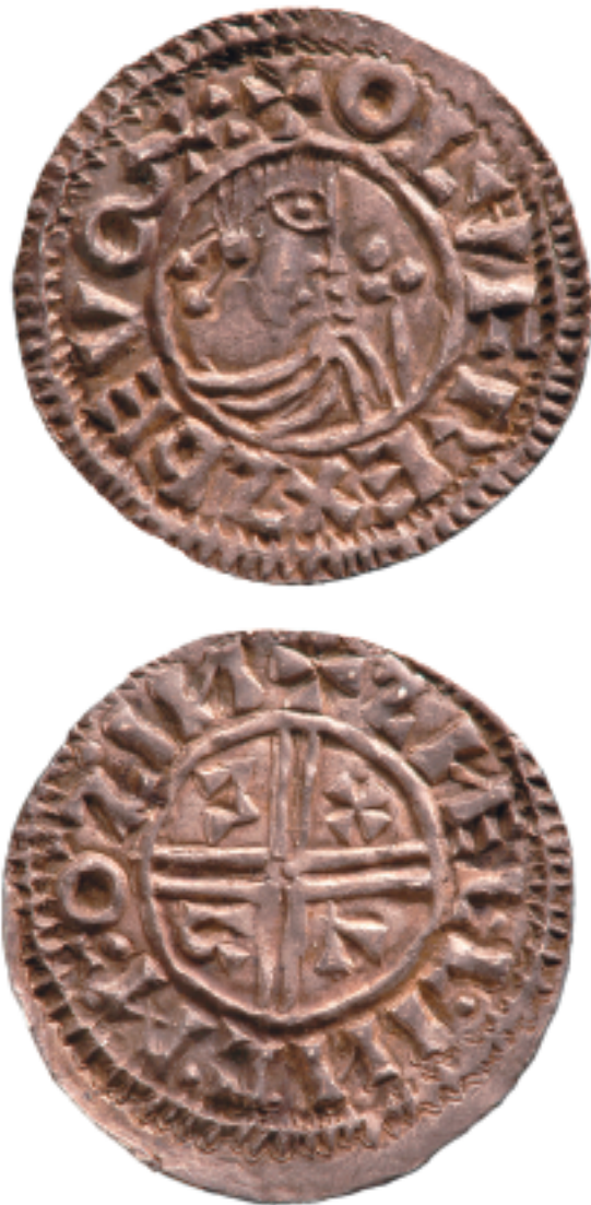
De första svenska mynten slogs i Sigtuna år 995. Mått: Ø 21, 8 mm.

På 1500-talet räknade man 4 mark på en daler. Mot den internationellt gångbara riksdalern försämrades markkursen stadigt. Redan 1609 gick det 6 svenska mark på en riksdaler, vid frihetstidens början 12 mark, och