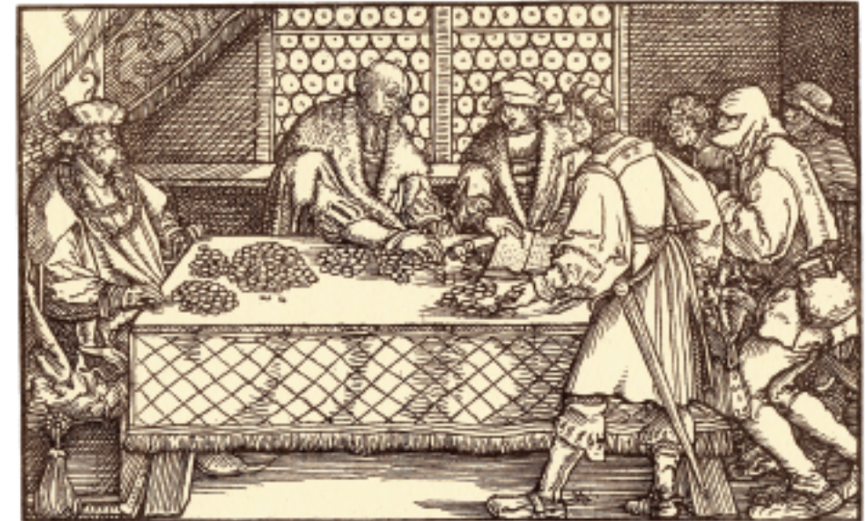
Växlarna underlättade handeln över gränserna. Växelskontor c:a 1550.

Under århundradena före Kristi födelse utvecklades spannmålsmagasi-