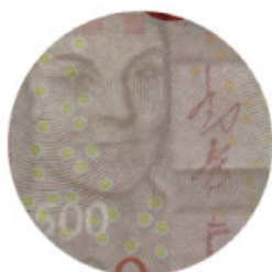
Bild (tre kronor) som lyser upp i gult och blått i UV-belysning. Det finns också fibrer spridda över hela sedeln som lyser upp i gult och blått.